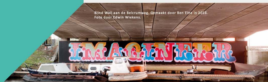
Blind Wall aan de Belcrumweg. Gemaakt door Ben Eine in 2016.

Wilt u een wandeling op maat boeken neem dan contact op met Breda Promotions ( www.bredapromotions.nl ).