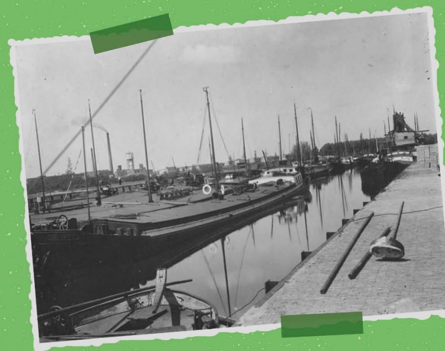
* vormgeving: Renie Lamers illustratie

De eerste stoomboot voer in 1860 de Belcrumhaven binnen en de laatste in 1930. (8)