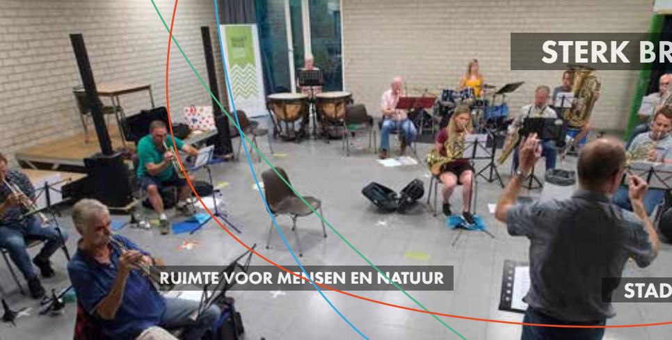
RUIMTE VOOR MENSEN EN NATUUR