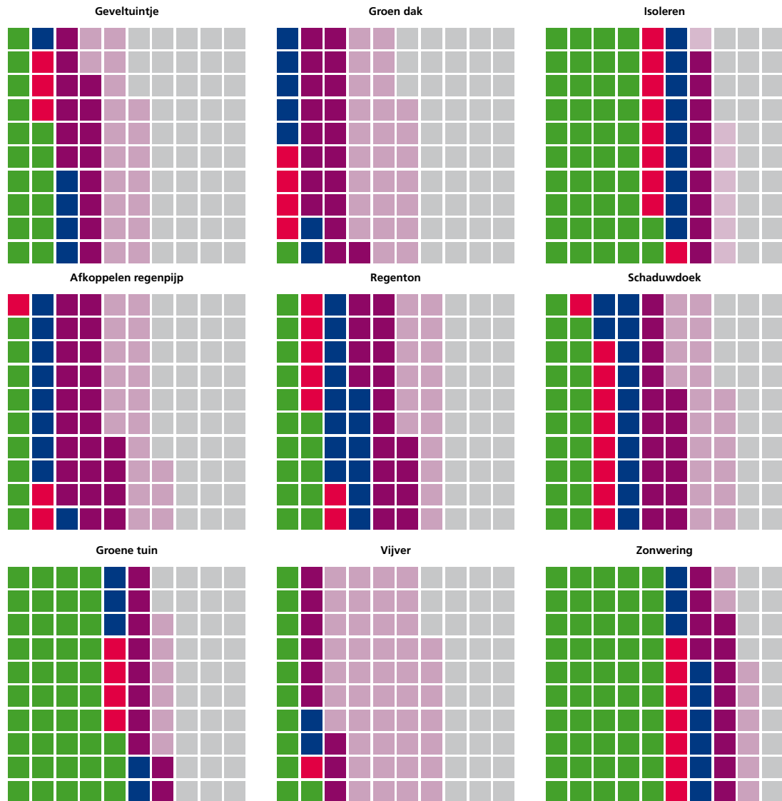
Figuur 5 laat zien welke klimaatadaptieve maatregelen de inwoners van Breda al hebben genomen of welke zij van plan zijn te nemen.